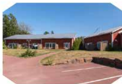
FAB Mejeribackan & FAB Meristorp