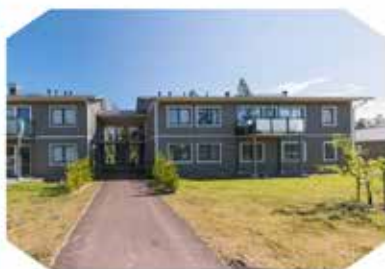
FAB Mildred & Naemi

Hör av dig redan idag så sätter vi dig på kö till ett boende som skulle passa dig i framtiden!